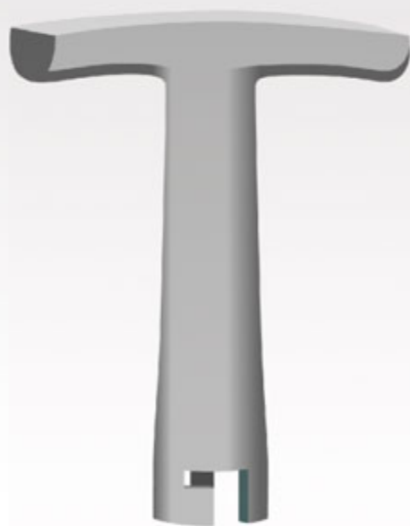
Il brevettato Sistema- 00622

Il Sistema valvola brevettato è stato sviluppato per l'utilizzo negli orinatoi a secco. Sostituisce l'acqua con la tecnologia. Utilizzando tre Valvole all'anno per orinatoio, il Sistema fa risparmiare da 80.000 a 120.000 litri di acqua all'anno.